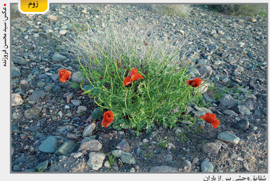
شقایق وحشی پس از باران