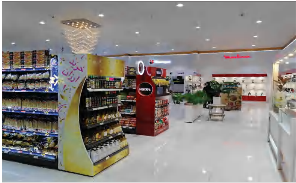
فروشگاه فرهنگیان کرمان