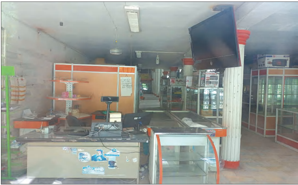
فروشگاه فرهنگیان سیرجان