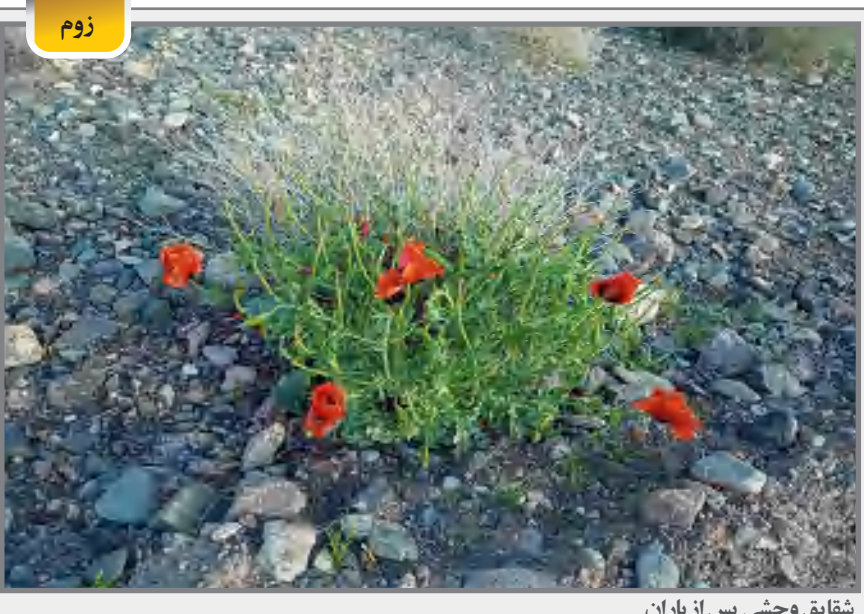
شقایق وحشی پس از باران