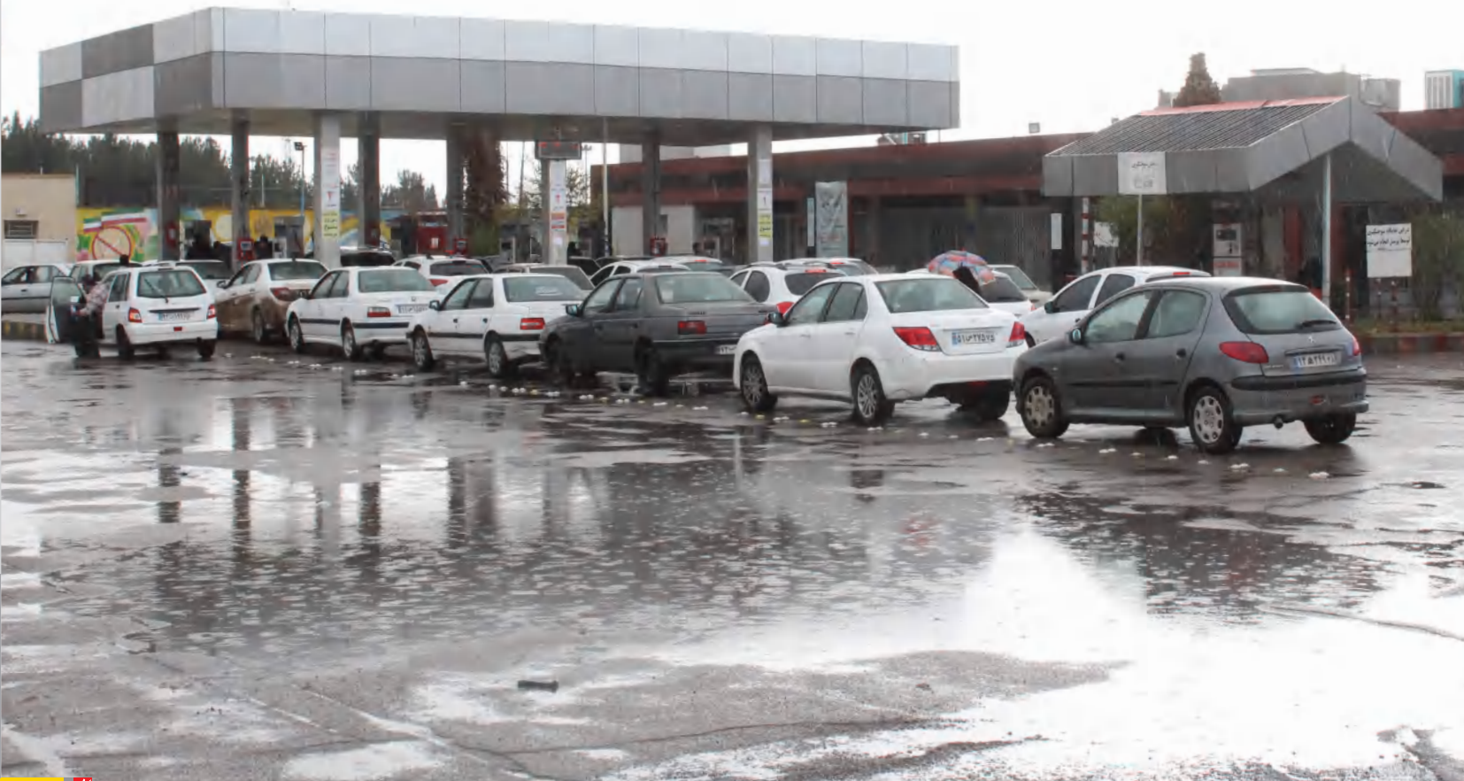
عکس: سید مصطفی کرزنده