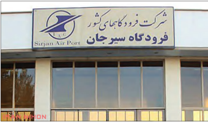
را دارند. وی تاکید کرد: شرکت های زاگرس و کاسپین به صورت برنامه ای در فرودگاه بین المللی کرمان فعال هستند. هواپیمایی جمهوری اسلامی، ماهان، آتا،

هر روز شلوغ است و اولویت پرواز را با بیماران گذاشتیم. مدیرکل فرودگاه های استان کرمان در ادامه از فرودگاه جیرفت سخن به میان آورد و گفت: در فرودگاه جیرفت برابر شرایط عملیاتی و اطلاعات اعلام شده در نشریه اطلاعات هوانوردی، آمادگی کامل برای پذیرش پروازهای مسافری و باربری را داریم.