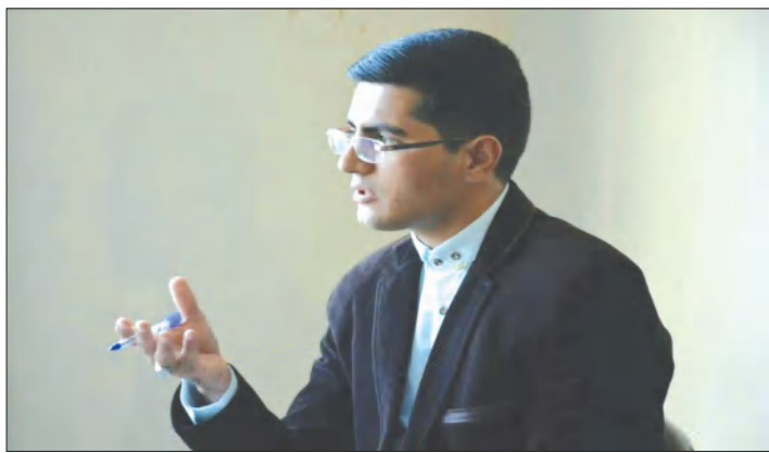
دستاوردها و خدمات دستگاه های مختلف حاکمیتی و از دیگر سوی امیدآفرینی از رهگذر انعکاس

در راستای جهاد تبیین، جزو کارویژه های این قشر فرهیخته است. مدیر روابط عمومی اداره ثبت اسناد و املاک شهرستان سیرجان با بیان اینکه روز خبرنگار فرصتی ارزشمند برای پاسداشت اصحاب رسانه به عنوان وجدان بیدار جامعه است ابراز داشت: خبرنگاران تجسم عینی دغدغه مندی و تعهد اند، که با روحیه ای کمال طلب در جهت اعتلای این مرز و بوم کوشش می نمایند و بنده هم از زحمات این عزیزان در حوزه های گوناگون به ویژه ترویج فرهنگ استفاده از سند رسمی و اطلاع رسانی اقدامات جهادگونه همکارانم در مجموعه سازمان ثبت اسناد و املاک کشور، قدردانی می نمایم.