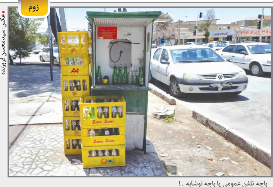
باجه تلفن عمومی یا باجه نوشابه!...