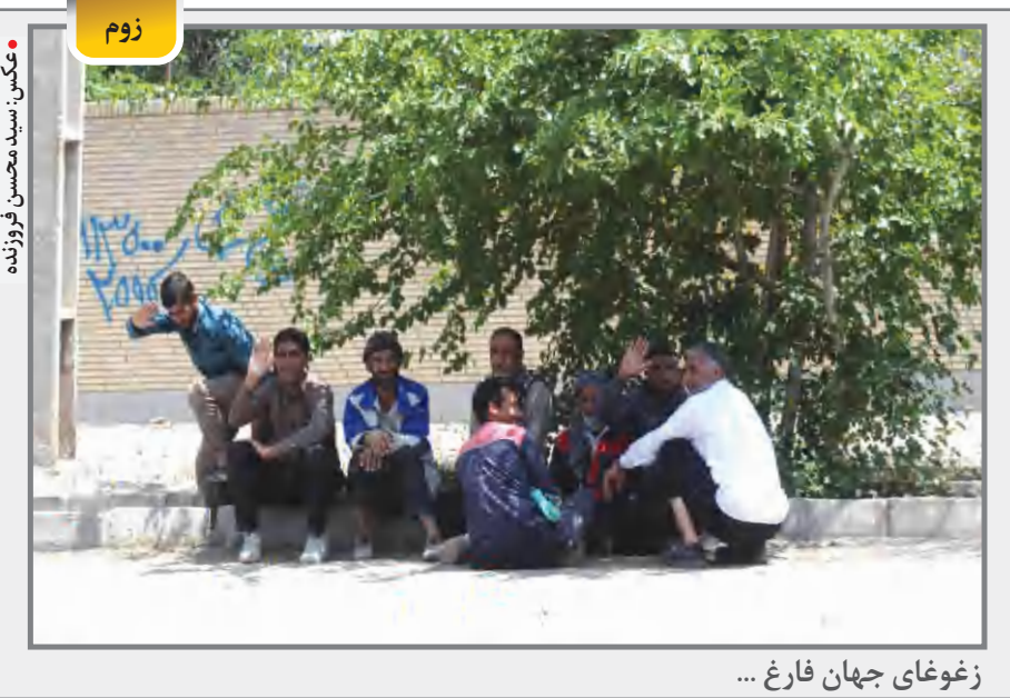
زغوغای جهان فارغ ...