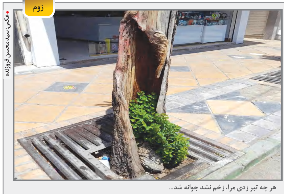
هر چه تیر زدی مرا، زخم نشد جوانه شد...