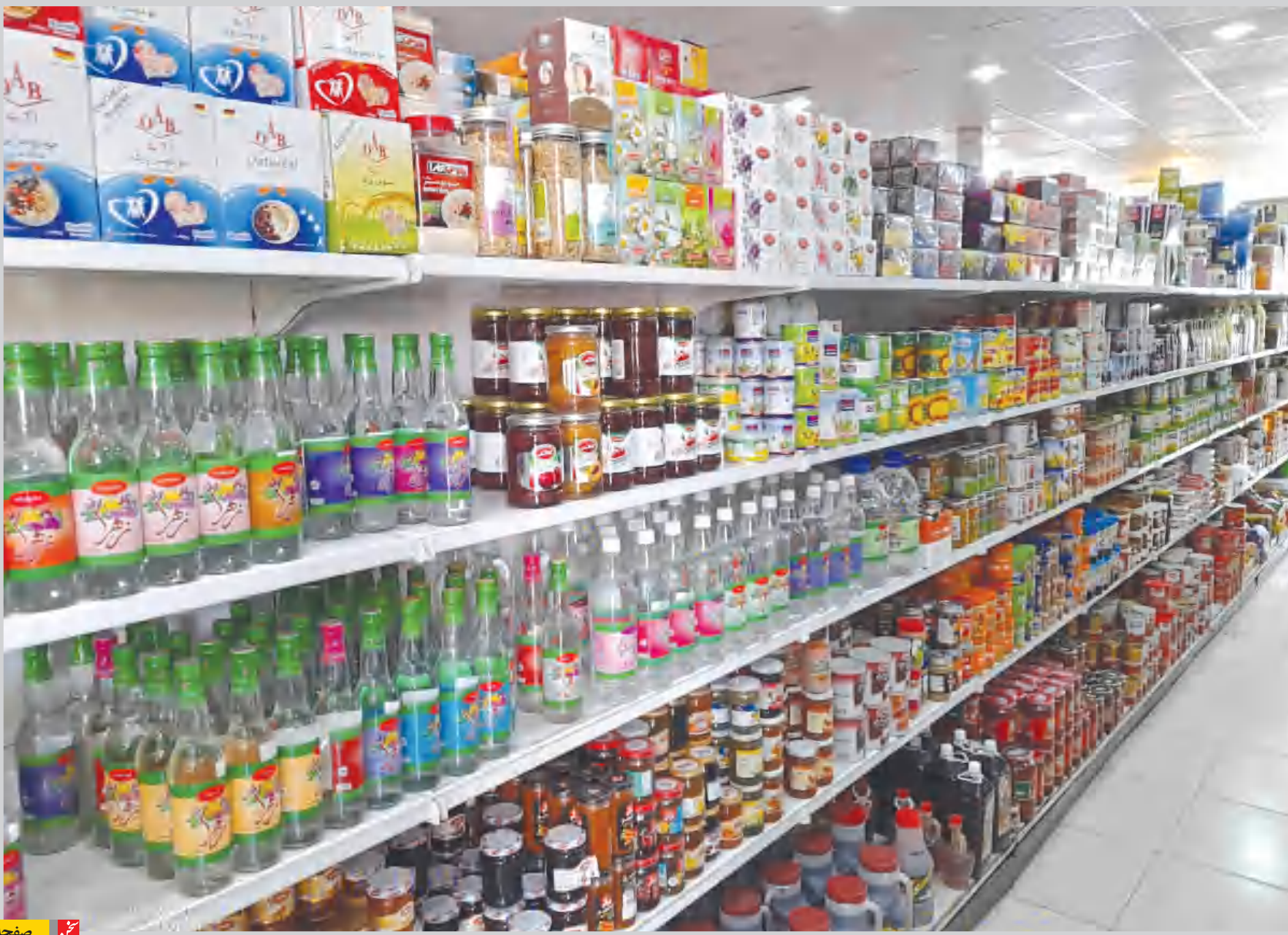
عکس: سید محسن فروزنده