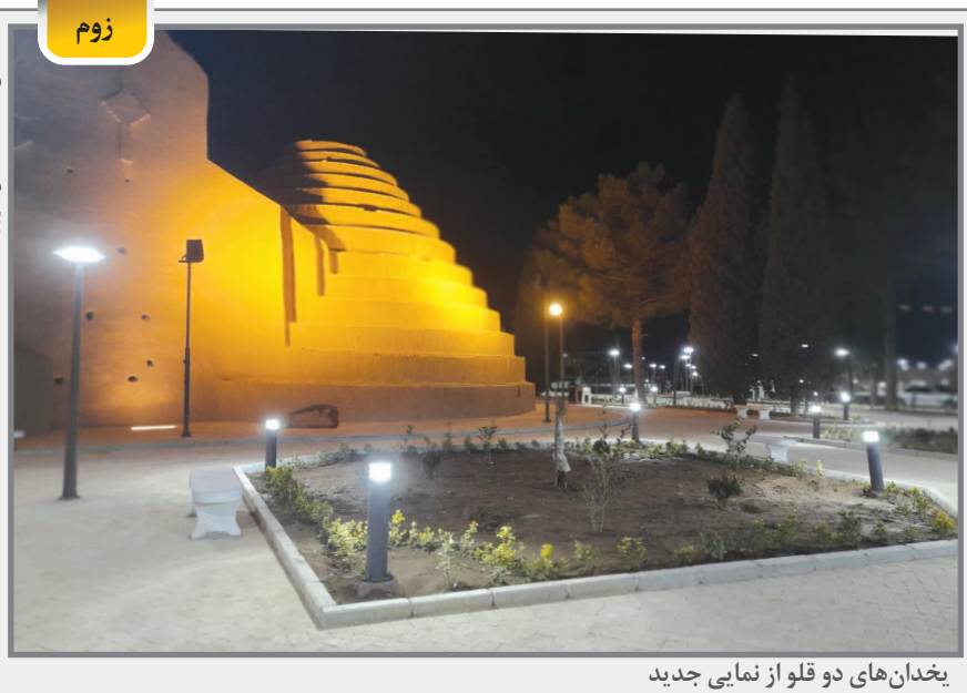
یخدان‌های دو قلو از نمای جدید