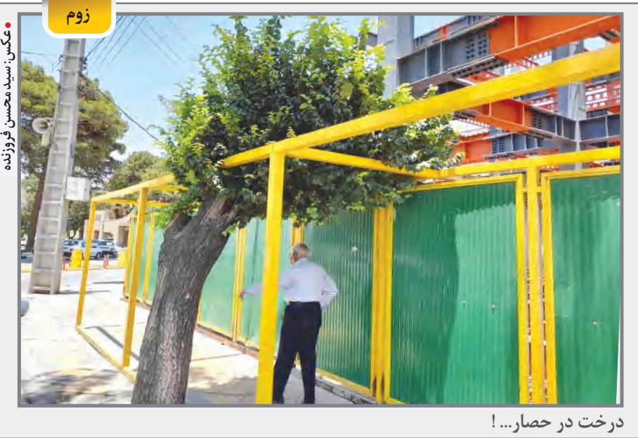
درخت در حصار...!