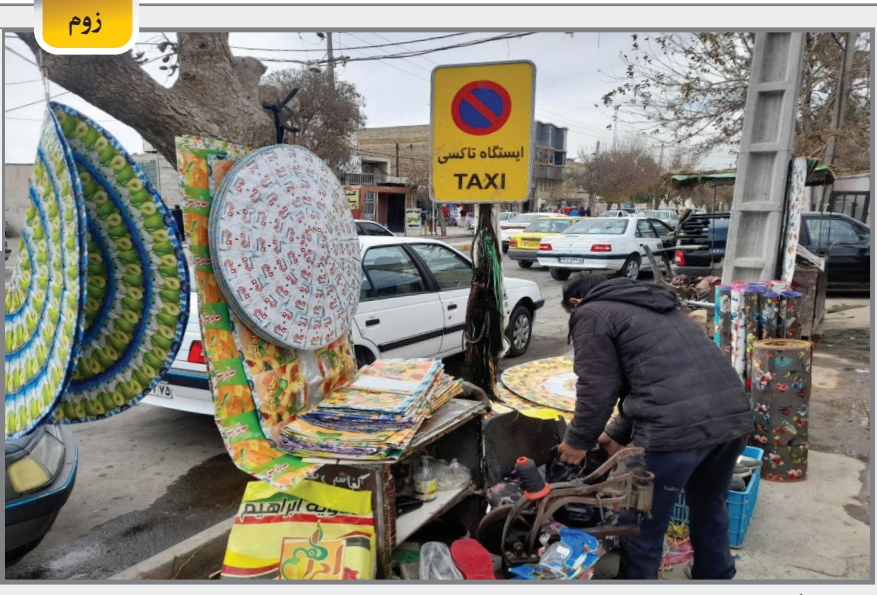
بدون شرح ...