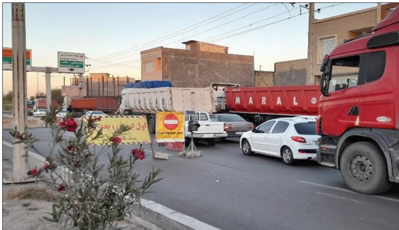
وقت کشی به سبک شورای ترافیک

همان طور که مشخص است در این قضیه انگار نه شهرداری مقصر است و نه خود گل گهر که کوشیده جور کم کاری‌های مسوولان شهری را بکشد و خود مستقیماً وارد عمل شده تا این بخش از ورودی شهر را -که سابق بر این مشکلات فراوانی داشته- روبراه کند. همانگونه که پیش از این نیز گل گهر جاده ابتدایی شهر را قبل از این پل برای استفاده ناوگان حمل و نقل خود مرمت و زیرسازی و آسفالت کرده بود، حالا هم دارد می‌کوشد تا ناهمواری‌ها و دست اندازهای تند و تیز پل دفاع مقدس را بگیرد.