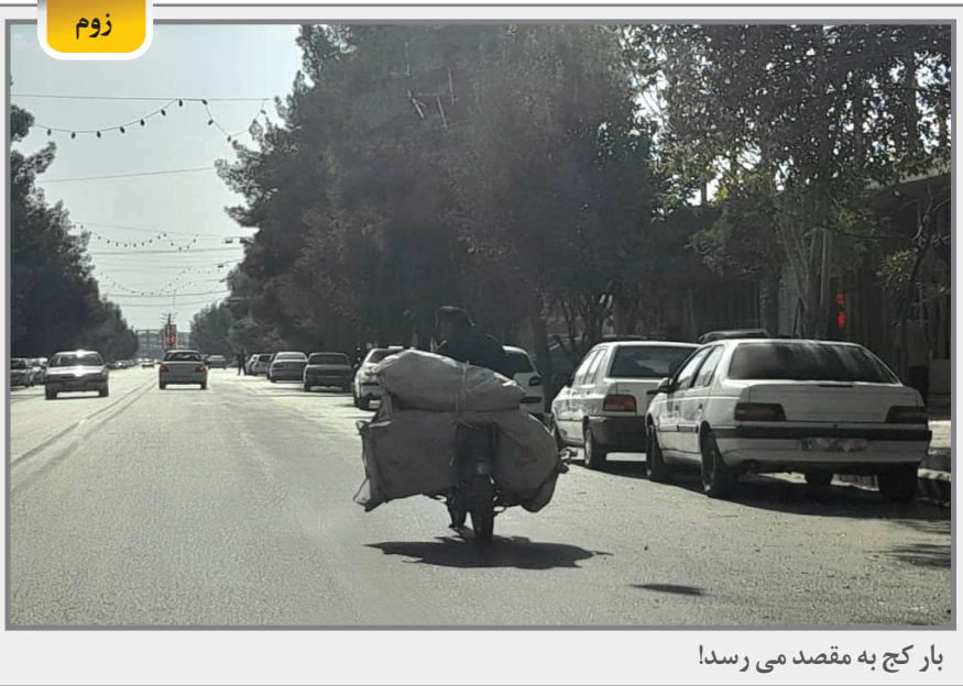
بار کج به مقصد می‌رسد!