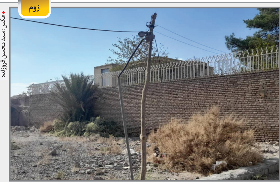
تیر کمان یا کافوی مخابرات!

توجه داشته باشیم که ما در خیلی از موارد در چهارچوب منافع چین و روسیه حرکت می‌کنیم، بدون اینکه منافع ما را در نظر بگیریم. در حالی که باید با پیشبرد ایجاد توازن در سیاست خارجی خود، به شعار «نه شرقی، نه غربی» برگردیم. در این صورت است که می‌توانیم کرمان را راست کنیم.