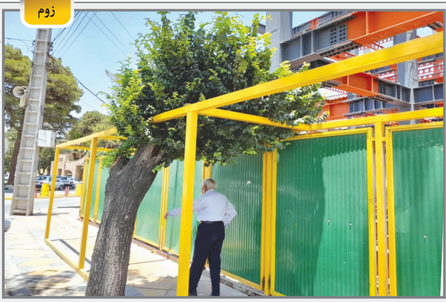
درخت در حصار...!