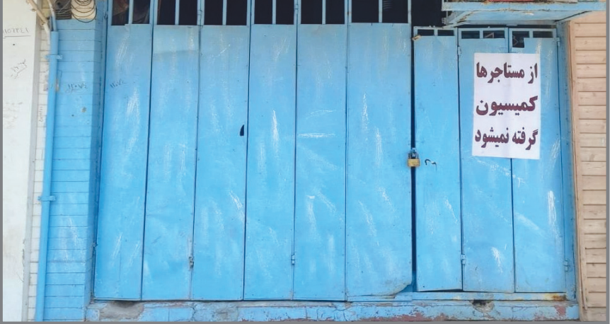
حرکت قابل تقدیر یک مشاور املاک