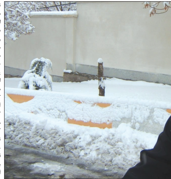
شاعر نبود. در زندگی ساده‌ی استاد جز کوشش همواره برای دانستن بیشتر، ردی از تلاش برای زرانندوزی