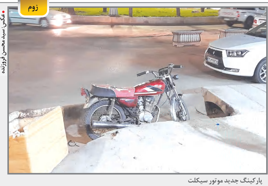
پارکینگ جدید موتور سیکلت