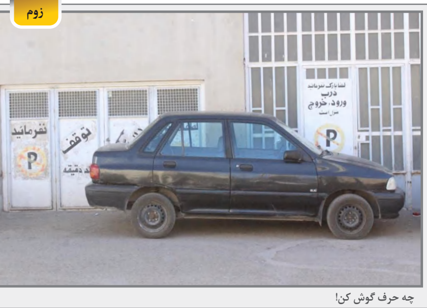
چه حرف گوش کن!

ایازی می‌گوید: حجاب تصمیمی شخصی است و هیچ کس نمی‌تواند درباره ویژگی‌های شخصی یک فرد مسلمان تجسس کند. به همین دلیل هر قانونی که به ازگان‌های خاص اجازه مداخله در امور شخصی مردم می‌دهد، حتماً باید اصلاح شود تا فاصله مردم با حاکمیت بیشتر از این نشود. البته اگر نماینده‌های مجلس واقعاً مستقل و مردمی باشند، می‌توانند بعد از بررسی‌های لازم درباره حجاب یا هر موضوع دیگری تصمیم بگیرند. اما مشکل اصلی ما عملی است که بر اساس قانون من‌درآوردی «نظارت استصوابی» است. شورای نگهبان هم در راس مداخله‌کنندگان قرار گرفته و با رد شایسته‌ها، فضا را برای پیروزی افراد با حداقل رای و بدون کارنامه قابل دفاع، فراهم می‌کند.