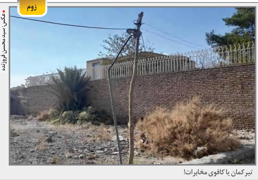
تیر کمان یا کافوی مخابراتا