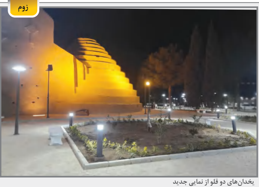
یخدان‌های دو قلو از نمای جدید