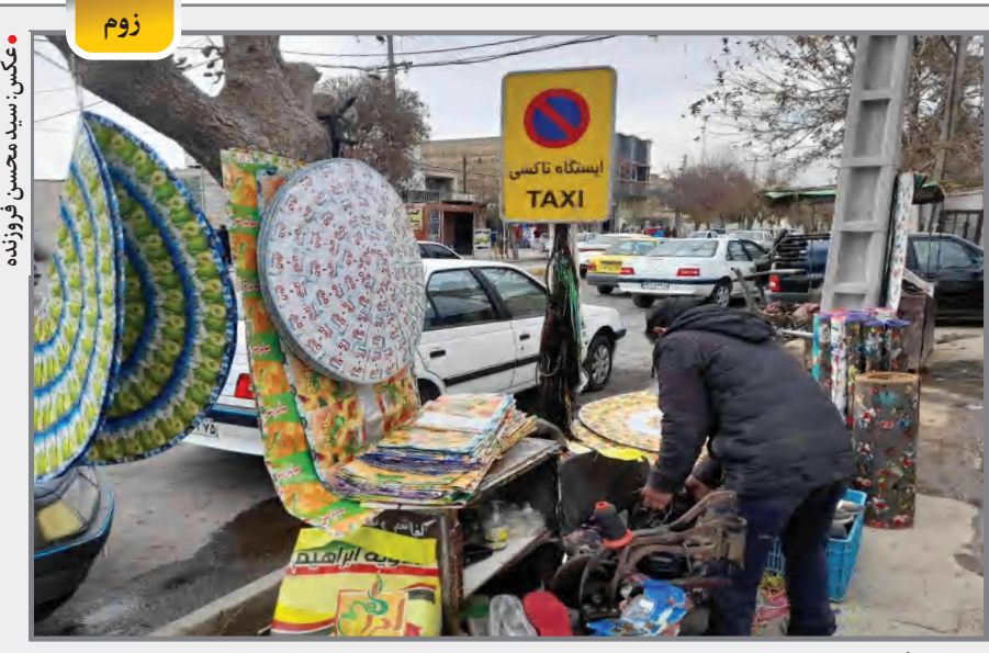
بدون شرح ...