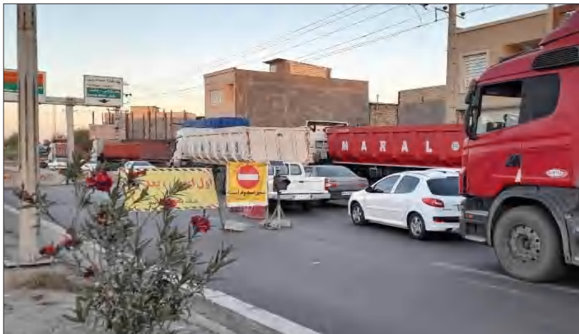
وقت کشی به سبک شورای ترافیک

همان طور که مشخص است در این قضیه انگار نه شهرداری مقصر است و نه خود گل گهر که کوشیده جور کم کاری‌های مسوولان شهری را بکشد و خود مستقیماً وارد عمل شده تا این بخش از ورودی شهر را -که سابق بر این مشکلات فراوانی داشته- روبراه کند. همانگونه که پیش از این نیز گل گهر جاده ابتدایی شهر را قبل از این پل برای استفاده ناوگان حمل و نقل خود مرمت و زیرسازی و آسفالت کرده بود، حالا هم دارد می‌کوشد تا ناهمواری‌ها و دست اندازهای تند و تیز پل دفاع مقدس را بگیرد.